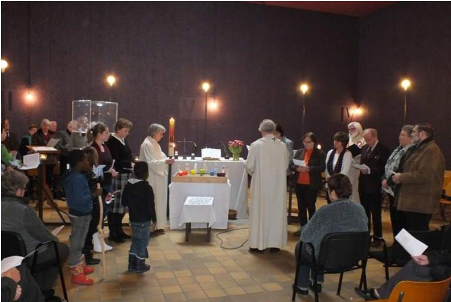
Oecumenische viering in de Andreaskerk