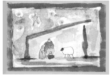
Nr. 461 "Kribbe"