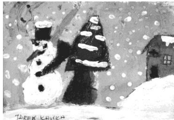
Nr. 477 "De wereld gezien door de ogen van de kinderen"