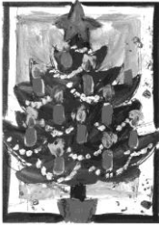
Nr. 464 "Oh Dennenboom"

Kijk op onze website voor onze collectie wens- en kerstkaarten, waarvan hier enkele zijn afgebeeld. De kaarten zijn met envelop en kosten 1 euro per stuk.