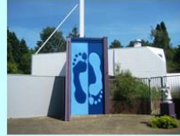
Enkele voorbeelden uit de praktijk van de Andreasparochie te Heerlen